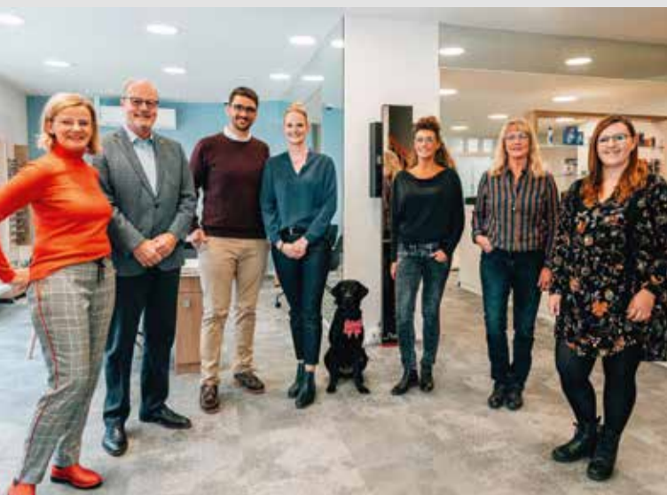
Ihr Team von Optik Firmenich